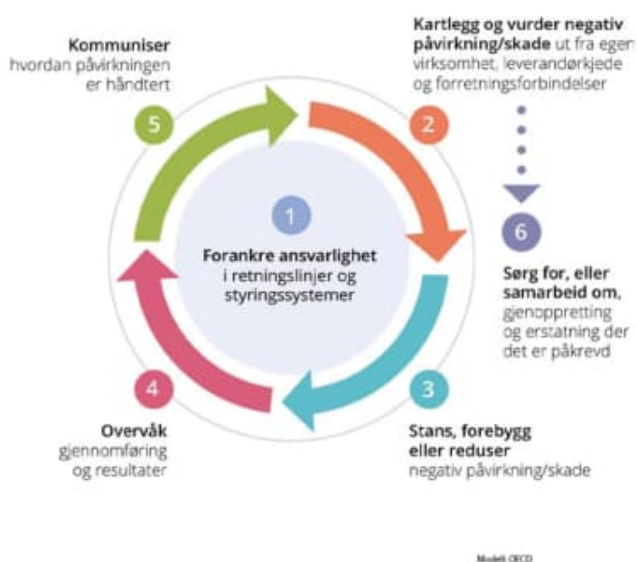
Figur 1 OECDs modell for aktsomhetsvurdering

Aktsomhetsvurderinger er en kontinuerlig prosess, som må gjentas årlig eller ved vesentlige endringer. Jæren Everk utfører risikovurderinger og aktsomhetsvurderinger iht OECDs modell.