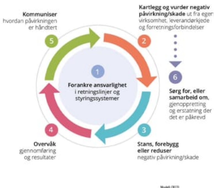
Figur 1 OECDs modell for aktsomhetsvurdering

Aktsomhetsvurderinger er en kontinuerlig prosess, som må gjentas årlig eller ved vesentlige endringer. Hå Energi utfører risikovurderinger og aktsomhetsvurderinger iht OECD s modell.